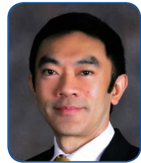
ศ.พ. ประวิตร อัครวานนท์

ปัจจัยทางพันธุกรรมก็อาจมีส่วนเกี่ยวข้อง เนื่องจากพบว่า มีเพียงสมาชิกในบางครอบครัวเท่านั้น ที่ป่วยเป็นโรคนี้ และพบว่าประมาณครึ่งหนึ่งของผู้ป่วยโรคสะเก็ดเงิน จะมีสมาชิกอย่างน้อยหนึ่งคนในเครือญาติที่ป่วยเป็นโรคนี้